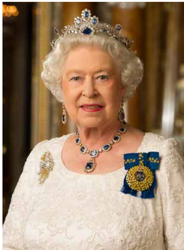
Королева Елизавета II

Австралийская система парламентской демократии отражает британские и североамериканские традиции, объединенные в уникальном австралийском стиле. В австралийской системе лидером австралийского правительства считается премьер-министр.